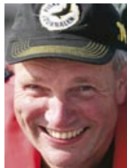
Rutinerade trollaren Rydarn kan Ruskenfisket utan och innan.

Jag undrar om jag fört över gårdagens "gösförbanelse" – inte en landad gös – från min egen båt till Rydarns ekipage. Ingen fara visar det sig. Nästa fisk är en gös... och nästa... och nästa. Inga bjassar men