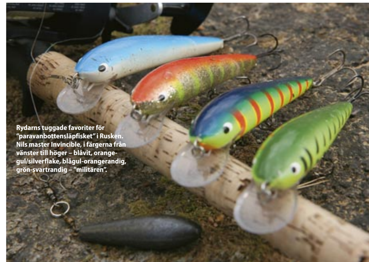
Rydarns tuggade favoriter för "paravanbottensläpfisket" i Rusken. Nils master Invincible, i färgerna från vänster till höger - blåvit, orange-gul/silverflake, blågul-orangerandig, grön-svartrandig - "militären".

av Sportfiskeforums bloggare. Jag får nöja mig med ett par stötar, en mindre gädda och en tandmärkt vit vertikaljigg.