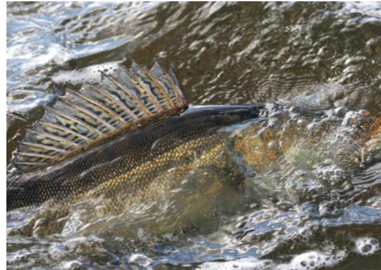
Rusken håller mängder av gös i mellanklassen. Varje år kommer det dock upp ett antal fiskar runt fem-sex kilo.