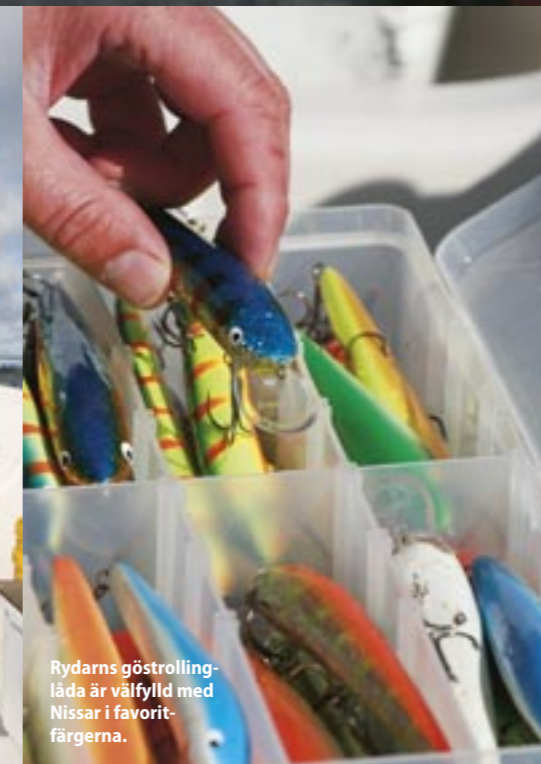
Rydarns göstrollingslåda är välfylld med Nissar i favoritfärgerna.