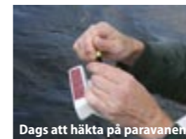
Dags att häkta på paravanan.